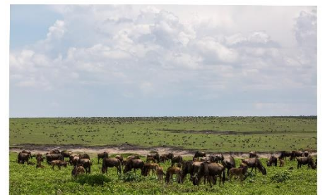
Troupeau de gnoux