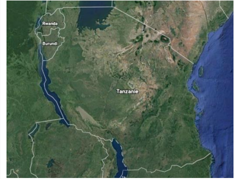
La Tanzanie vue du ciel

L'archipel de Zanzibar fait partie de la Tanzanie.