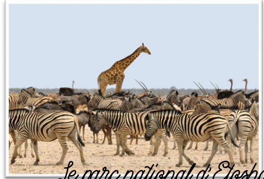
Le parc national d'Etosha