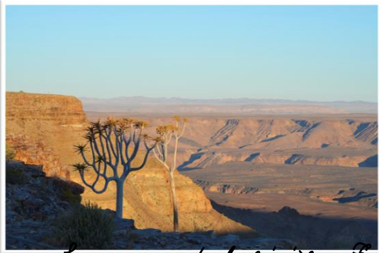
Le canyon de la rivière Fish