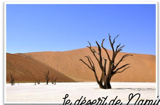
Le désert de Namib