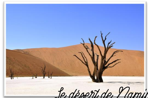
Le désert de Namib