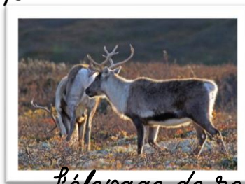
L'élevage de rennes