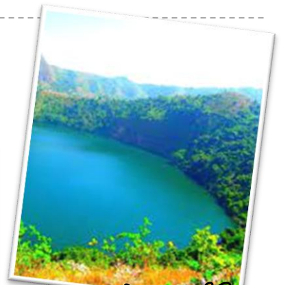
Le lac Nyos