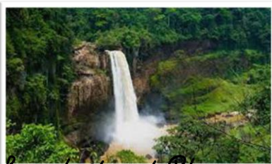
Les chutes d'Ekoum

Le Cameroun est surnommé « L'Afrique en miniature » car il possède une grande diversité de climats, géographique et culturelle.