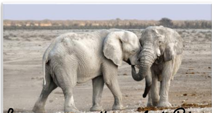
Le parc national d'Etosha

La Namibie est caractérisée par une grande partie de climat désertique. Mais la faune et la flore y est très riche dans le reste du pays.