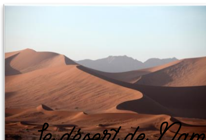
Le désert de Namib